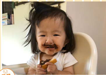
笑顔部門 「美味しい おひげ」 美味しいものを食べるとおひげが生えてくる様です。 撮影地：福岡県飯塚市