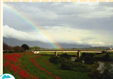
ふるさと部門 「彼岸花と虹」 「ホーム」に入所している母が「去年も見たから行かん」と近くの彼岸花見物に行かず一人居残っていたので、写真を見せてやろうと夕方出かけました。遊歩道を下っていくとパラパラ雨が落ち、突然虹が！慌てて2回シャッターを押すと、もう消えていました。 撮影地：河川敷公園