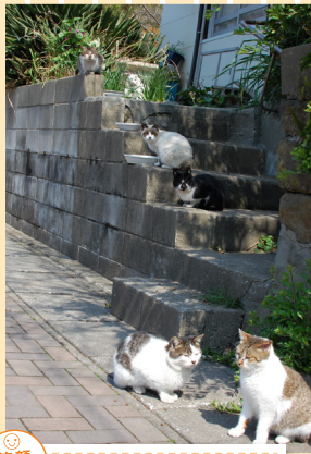
笑顔部門 「何匹いるでしょう？」 猫だらけの島に行ってきました。猫好きにはたまらない場所です！ 撮影地：福岡県北九州市 藍島