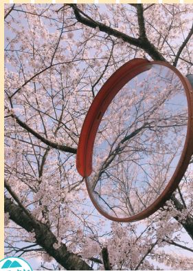
ふるさと部門 「自慢の故郷」 三重県から福岡に引っ越してきて1年、地元で撮った写真を見るたび故郷が恋しくなります。 撮影地：三重県いなべ市