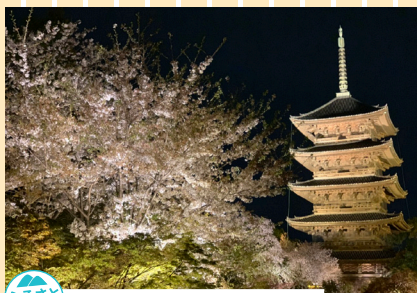
ふるさと部門 「夜桜と五重塔」 故郷で高校の同窓会があった時に撮影したものです。福岡に住んでからは行く機会がありませんので思い出しになりました。 撮影地：京都府京都市