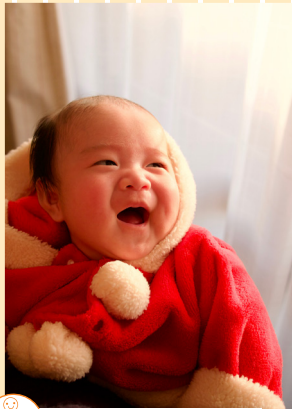
笑顔部門 「初めてのクリスマス」 昨年9月に生まれた息子の初めてのクリスマス。サンタの衣装を着て、満面の笑みを見せてくれました。 撮影地：自宅