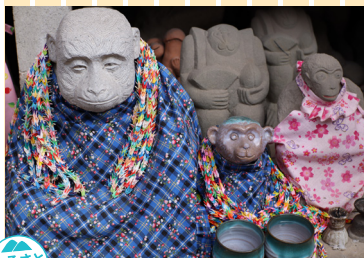
ふるさと部門 「庚申社のお猿さん」 今年初に庚申社行きました。大安吉日 撮影地：福岡県直方市多賀神社下庚申社