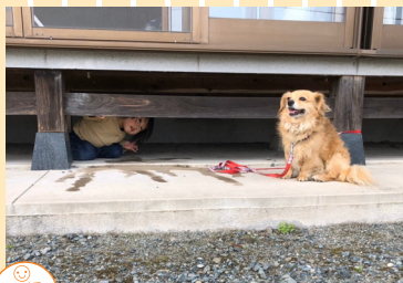
笑顔部門 「ボク ここよ」 ドル(犬)の縄張りに入って来た為にじけて出ていきました。 撮影地：福岡県飯塚市