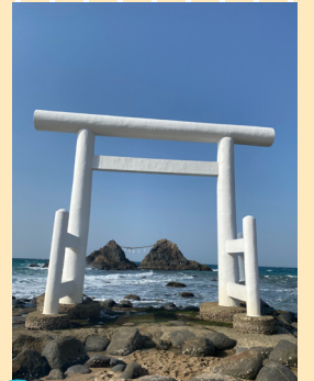
ふるさと部門 「鳥居越しの夫婦岩」 海がない地域に住んでいるので帰郷した時に海を満喫しています。 撮影地：福岡県糸島市