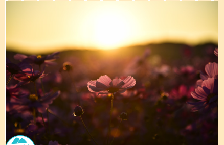
ふるさと部門 「乙女の純潔」 故郷筑豊のコスモス畑の夕焼けを撮影しました。 撮影地：福岡県鞍手郡鞍手町新北