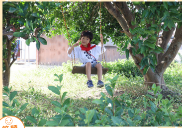
笑顔部門 「お父さんのブランコ」 お父さんが自衛隊に勤めていて、手作りでみかんの木にブランコを作ってくれました。今日は剣神社の4年に一度のお祭り日、チサちゃんはニコニコです。 撮影地：直方市下新入別田