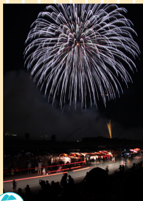
ふるさと部門 「夜空に咲く大輪の花」 花火大会では懐かしい友人に再会することもあります。 撮影地：福岡県直方市