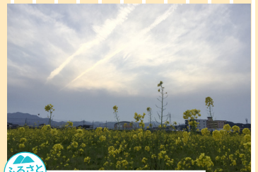
ふるさと部門 「菜の花と飛行機雲」 小さな頃に河川敷の菜の花に囲まれて遊んだ記憶が懐かしいです。 撮影地：福岡県直方市