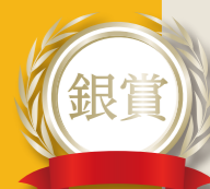
「わたしのお気に入り」 シャボン玉大好きな今の娘の姿を残したくて夏らしい沢山の風鈴と一緒に、シャボン玉師のしゃーぼんぼんさんにしよせを届けてもらい幸せいっぱいな娘。 撮影地：三井寺