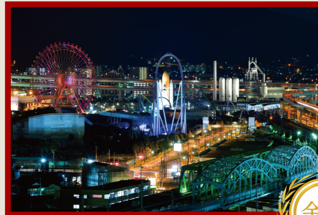
「またいつか、別の星で…」 2018年1月1日をもって閉園及び別の星に旅立った世界に先駆けた伝説のテーマパーク「スペースワールド」。その閉園直前の姿と鉄の街「北九州市」のあの日の思い出です。 撮影地：福岡県北九州市